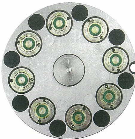
Kupplungsseite des Sweeper-Systems

Neuentwicklungen, die auf das Ausbauen des vollautomatischen Teilehandlings abzielen, gehört das System „Sweeper“, ein sehr flach bauendes Nullpunkt Spannelement. Zum einen können, durch den zum Teleskop ausgeführten Mittenverschluss, keine Späne in die Spannbohrung gelangen, zum anderen werden die Späne auf den Auflageinseln mit ausfahrbaren Düsen abgeblasen (auch bei Tropfspänen). Zu den Trends gehört zudem, dass verstärkt