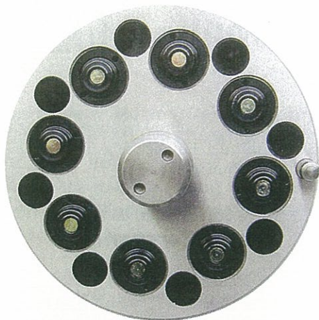
Nippelseite des Sweeper-Systems

Neuentwicklungen, die auf das Ausbauen des vollautomatischen Teilehandlings abzielen, gehört das System „Sweeper“, ein sehr flach bauendes Nullpunkt Spannelement. Zum einen können, durch den zum Teleskop ausgeführten Mittenverschluss, keine Späne in die Spannbohrung gelangen, zum anderen werden die Späne auf den Auflageinseln mit ausfahrbaren Düsen abgeblasen (auch bei Tropfspänen). Zu den Trends gehört zudem, dass verstärkt